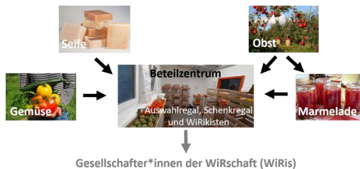
Abb. 3: Güterverteilung übers Beteilzentrum

Zentrale Komponente der Logistik ist das Beteilzentrum (siehe Abb. 3). Die innerhalb der WiRschaft hergestellten Güter werden ins Beteilzentrum geliefert, teilweise dort portioniert und anschließend an alle Gesellschafter*innen verteilt. Der größte Teil der Güter wird nach der Systematik „Beteil nach Zeit“ 10 verteilt und ein kleinerer Teil wird verschenkt.