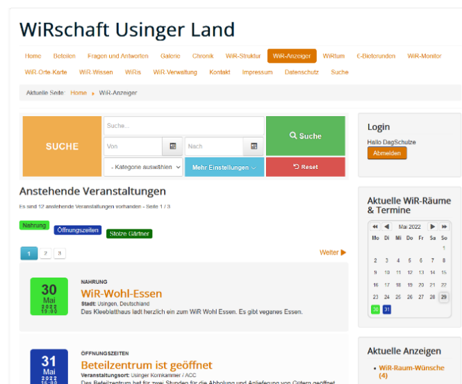
Abb. 2: WiR-Anzeiger im internen Bereich der Website

Die Gruppenkommunikation und -organisation der WiRschaft erfolgt über einen internen Bereich der Website, E-Mails, Arbeitskreise, Telefonate sowie physische und virtuelle Treffen. Angelegenheiten der Gesamtgruppe werden in den monatlichen Online-Treffen (WiR-Online) besprochen. Mehrere teilweise temporäre Arbeitskreise dienen der Organisation von wichtigen Teilbereichen innerhalb der WiRschaft. Derzeit sind die Arbeitskreise NetzwerkGärtnern , Gemeinschaftliche Grundversorgung , Gemeinsame Transformation und Gesundheit aktiv. Die Organisation der teilweise kleinteiligen Tätigkeiten erfolgt hauptsächlich über den WiR-Anzeiger im internen Bereich der Website (siehe Abb. 2). Dort können Gemeinschaftsaktivitäten angekündigt werden, die dann in einem Kalender erscheinen. Es können Ideen und Wünsche für zukünftige Aktivitäten kommuniziert, Unterstützungsangebote und -wünsche dargestellt sowie Gegenstände zum Verschenken inseriert werden.